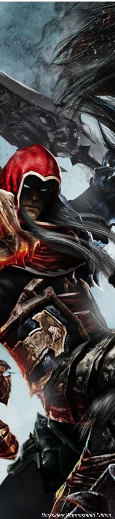
Darksiders Warmastered Edition