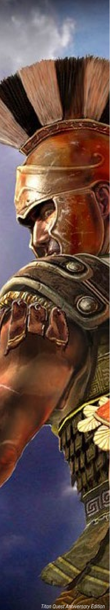
Titan Quest Anniversary Edition