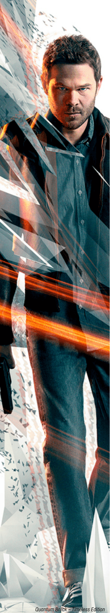
Quantum Break – Timeless Edition