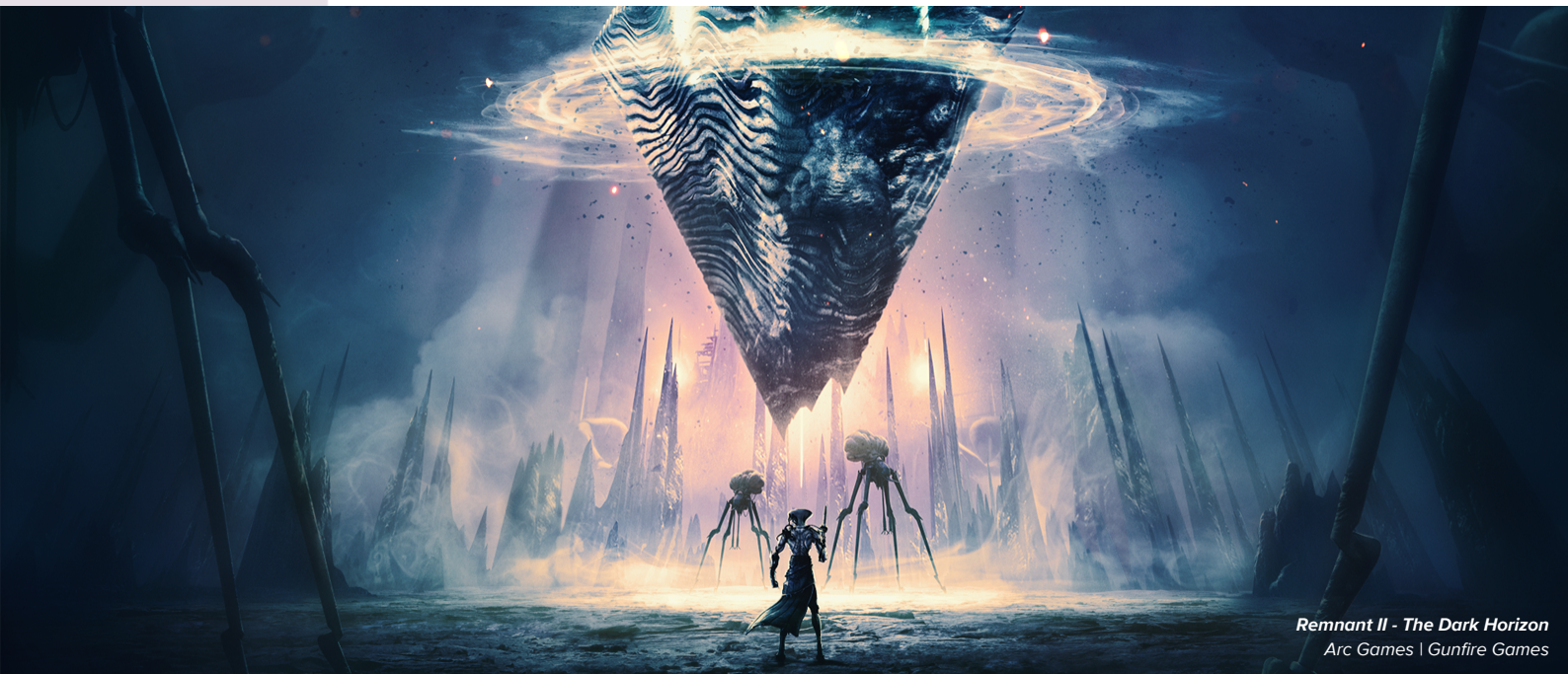
Remnant II - The Dark Horizon Arc Games | Gunfire Games