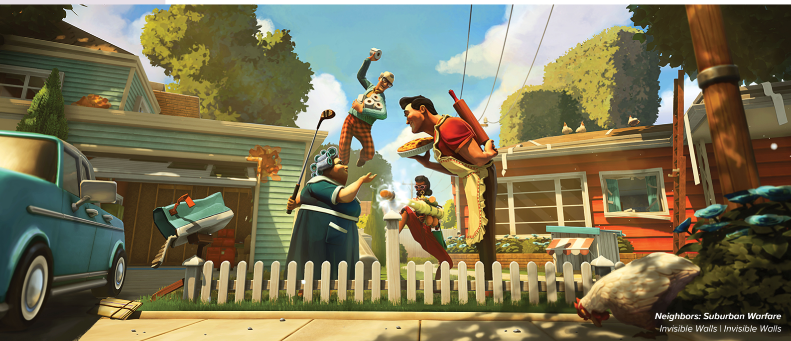
Neighbors: Suburban Warfare - Invisible Walls | Invisible Walls

Lanseringslistan inkluderar inte DLCs och "Work-For-Hire" projekt.